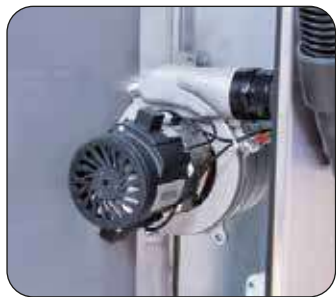
Soffiante Air Dry 220 (di serie)