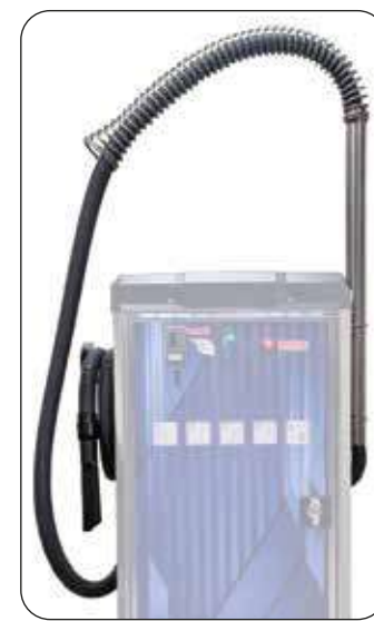
Braccio tenditubo a molla (di serie Air Dry 380 PRO)