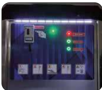
Kit illuminazione a led (optional)