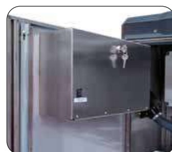
Cassetta monete con serratura a chiave (di serie)