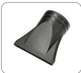
Diffusore aria (di serie)