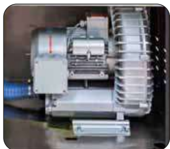
Soffiante Air Dry 380 PRO (di serie)