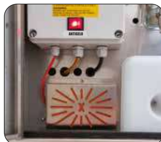
Kit antigelo (optional)