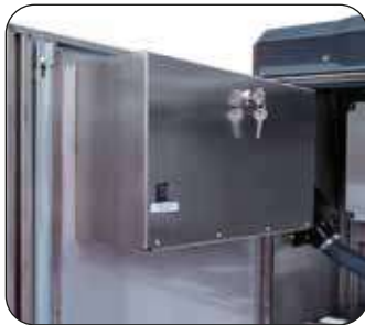
Cassetta monete con serratura a chiave (di serie)