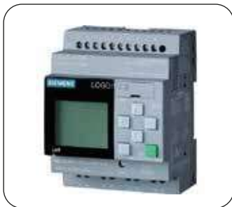
PLC (di serie)