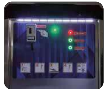
Kit illuminazione a led (optional)