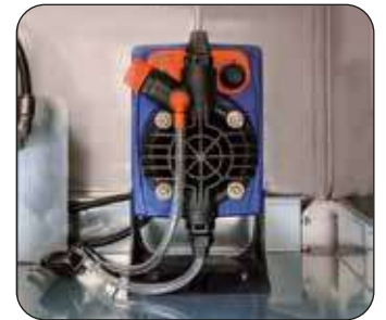
Pompa dosatrice detergente (di serie)