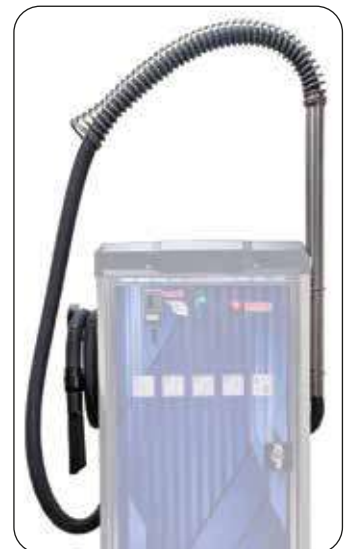
Braccio tenditubo a molla (optional)