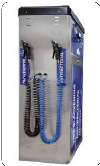
Erogatori kit servizi opzionali