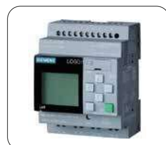
PLC (di serie)