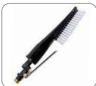
Spazzola erogazione schiuma (di serie)