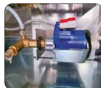
Pompa elettromagnetica (di serie)