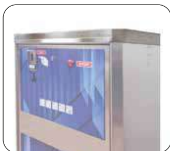
Calotta in acciaio inox (optional)