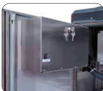
Cassetta monete con serratura a chiave (di serie)