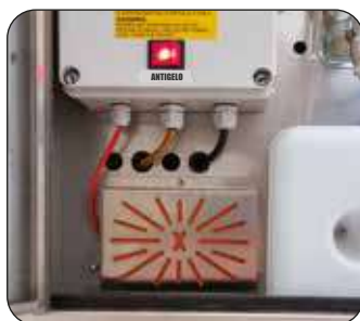
Kit antigelo (optional)