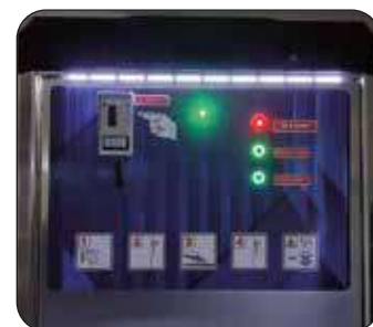
Kit illuminazione a led (optional)