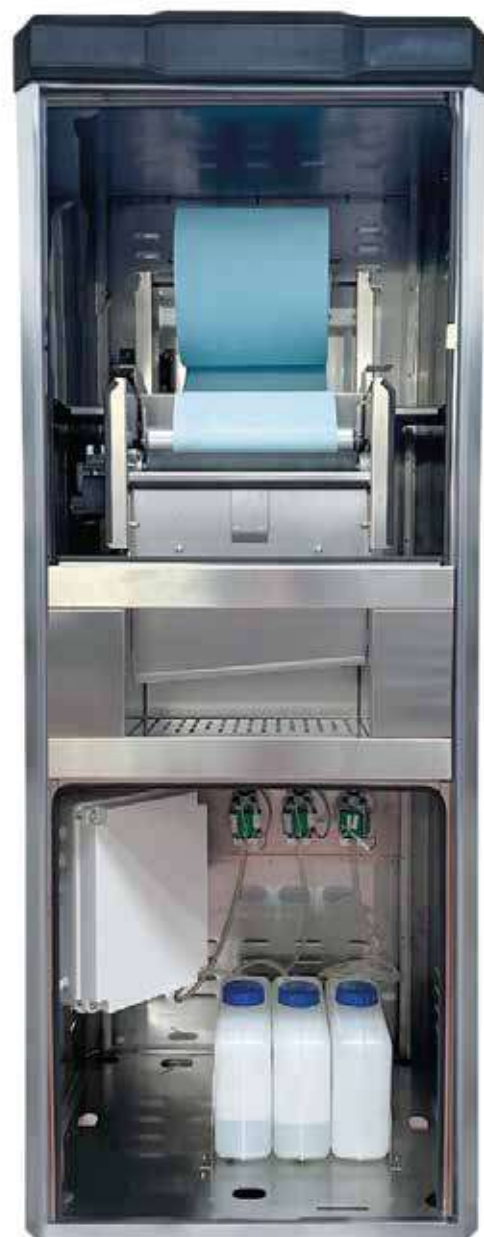
PRO ROLL TNT WET