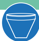
FILTRO CONICO IN POLIESTERE